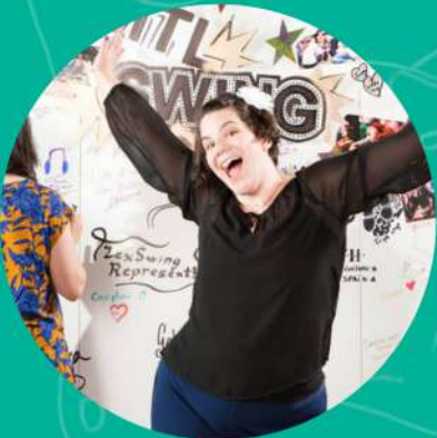
MARIA M Jedi M&M