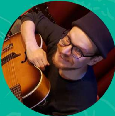
PHILIPPE GAUTHIER Bar