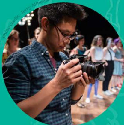
ALAIN WONG Photographe, Vidéographe