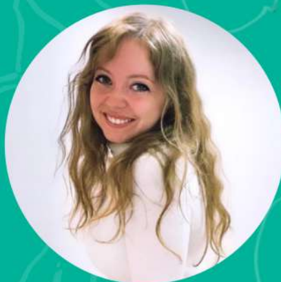
VANESSA ERVIN Designer du livret de CCX, Photographe